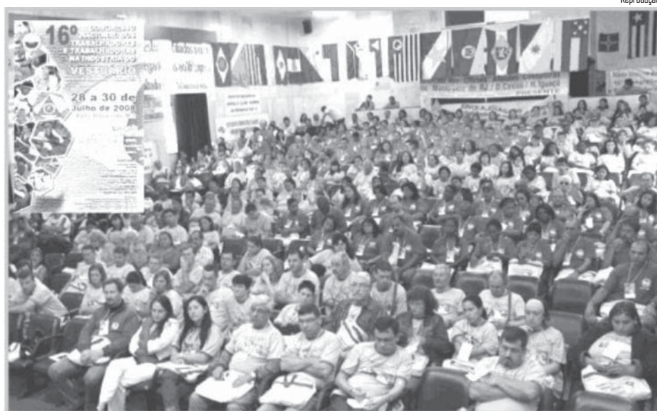
Mais de 400 congressistas de todo o país participaram do evento na capital mineira

Dentre os temas abordados estavam: 1) o processo eleitoral: a presença feminina nas instâncias do poder; 2) Trabalho e trabalhadores na indústria de calçados e a reestruturação produtiva do vestuário no Brasil; 3) Ministério do Trabalho e Emprego – MTE: suas ações na estrutura sindical e no setor vestuário; 4) Globalização e política macroeconômica do setor vestuário; 5) Leis Trabalhistas e Previdenciárias: